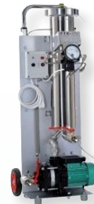
FTK FF 1-6 PM Mobil